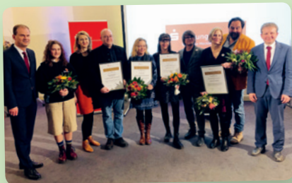
Die Preisträger des Kunst- und Kulturpreises 2022