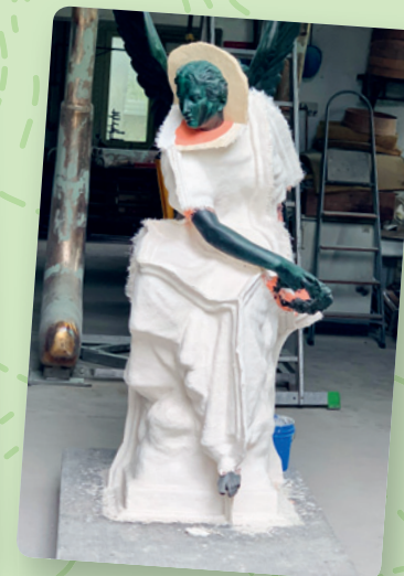
Die Gießerei Seiler in Schöneiche bei Berlin hat einen Abguss der lebensgroßen Viktoria aus dem Park Sanssouci (Potsdam) geschaffen.

Um den historischen Figureschmuck aus dem 19. Jahrhundert weiter zu vervollständigen und damit der Parkanlage ihr authentisches Gesicht wiederzugeben, entschied sich der Verein der Freunde des Schweriner Schlosses e. V. im Jahr 2021, diese Skulptur mit Hilfe von Spenden und Fördermitteln rekonstruieren zu lassen. Die Abformung von der ebenfalls lebensgroßen Viktoria von der Terrasse am Orangerieschloss in Potsdam Sanssouci konnte aus eingeworbenen Spenden durch den Verein finanziert werden.